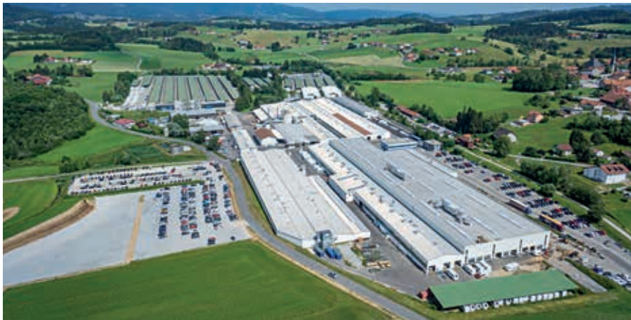
KNAUS Tabbert Werk Jandelsbrunn, im Hintergrund die Berge des „Waldes“