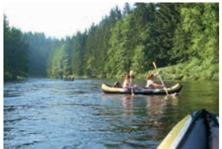
Viel Spaß beim Kanufahren