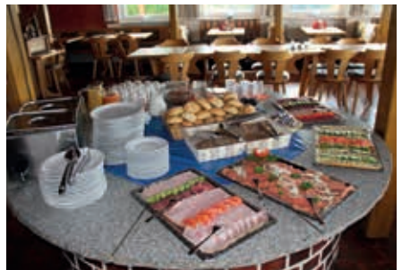
Georg Schmidbauers Frühstücksbuffet im Parkrestaurant