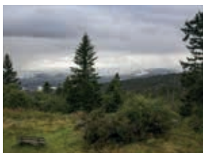
Blick zum Alpenkamm