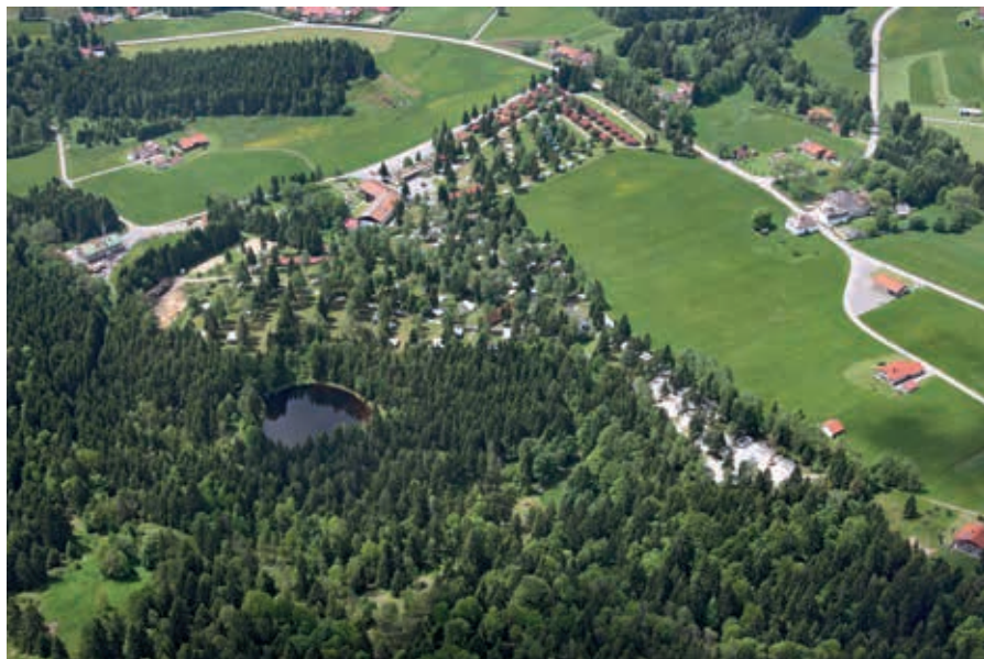
KNAUS Campingpark Lackenhäuser im Dreiländereck D/A/CZ