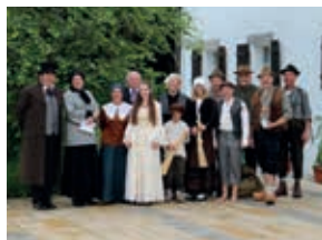
Einige Szenen aus der Theaterwanderung