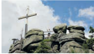
Höher geht's nicht mehr