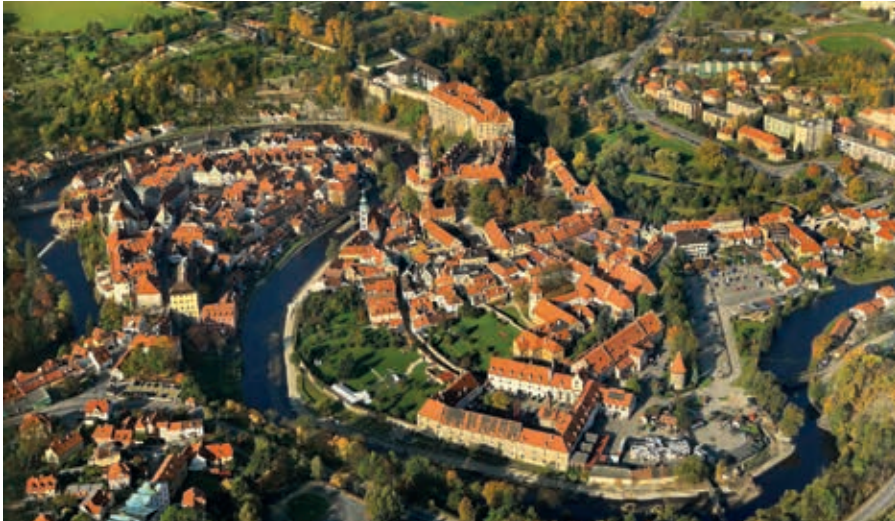
UNSECO Weltkulturerbe Krumau aus der Vogelperspektive

Krumau wird auch als „Venedig an der Moldau“ bezeichnet. Historische Wege und Gassen durchqueren diese romantische, böhmische Perle, die von der „blauen Moldau“ eingerahmt ist. Wir genießen diesen Tag und erleben diese herrliche Stadt!