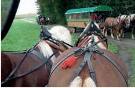
Die „Taxis“ stehen bereit