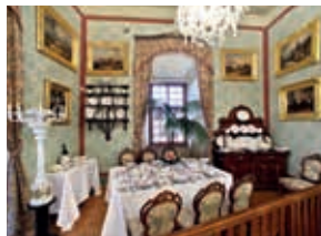
Schloss Bellaria in Böhmisches Krumau

Vom Wirtshaus spazieren Sie fünfzehn Gehminuten bergwärts durch die Altstadt über den „Bärengaben“ in die Burg und den sehr weiträumigen Schlosshof. Dort erwartet Sie um 14.30 Uhr die deutschsprachige Führerin im Schlosshof II an der Kasse. Die Schlossführung mit den Innenräumen dauert für die ausgewählte Variante eine Stunde. Mindestteilnahme: 20 Gäste, max. 40 Gäste. Kosten ca. 11,00 €/Person, zahlbar bei Anreise in Lackenhäuser. Sie befinden sich nach der Führung direkt im Zentrum der Altstadt und haben anschließend zwei Stunden Zeit zur freien Verfügung bis 17.30 Uhr. Den Bus finden Sie an der gleichen Stelle wie beim Ausstieg, nämlich am Parkplatz der Brauereiwirtschaft.