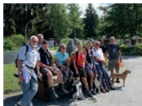
Vor dem Start

13.00 Uhr Traditionswanderung auf den Hausberg der Lackenhäuser Waldler, den Dreisessel Berg (1.312 m). Durch dichte Wälder, immer entlang des sagenumwobenen Witikosteiges wandern wir zweieinhalb Stunden und fünfhundert Höhenmeter bergauf. Wir gehen gemütlich und haben immer Zeit für einen Blick nach Süden, bei guter Wetterlage bis zu den Zentralalpen in 150 km Entfernung. Am Berggasthof auf 1.312 m angekommen schauen wir nach Böhmen hinunter, auf den tschechischen Nationalpark „Sumava“. Im Osten grüßen die dichten Wälder Oberösterreichs. Unser Wanderpfad, der auch ein Stück weit auf tschechischem Staatsgebiet verläuft, lohnt mit einer zünftigen Einkehr. Begleiten Sie unsere Traditionswanderung!