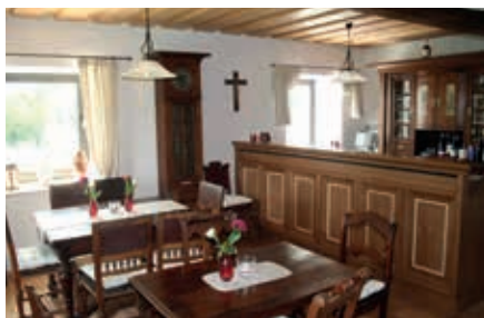
Rosenberger Gut und gegenüber das alte Wirtshaus