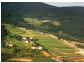
Campingpark im Bau