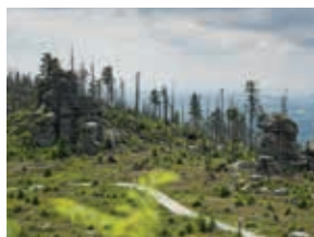
Der Orkan hat gewütet