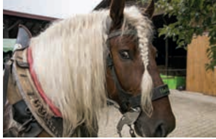
Hektor geht die Puste nicht aus