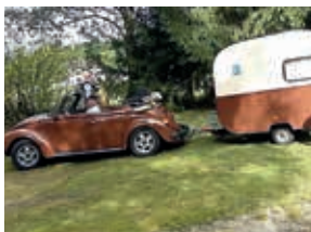
Ein Veteran unter uns