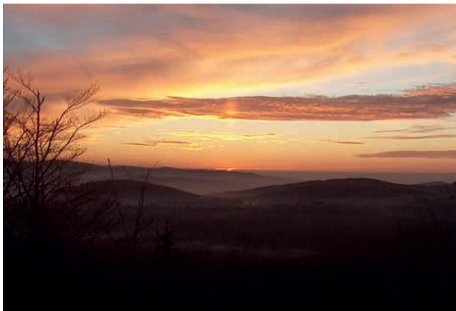
Morgenstimmung im Bayerischen Böhmerwald