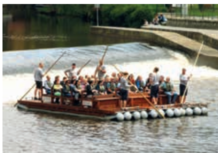
Lustige Floßfahrt auf der Moldau

Vom Wirtshaus spazieren Sie zehn bequeme Fußminuten zum „Hafen“. Die Flößer heißen uns willkommen. Jedes Floß ist für etwa zwölf Personen vorgesehen. Sie sitzen auf Bänken und tragen zu Ihrer Sicherheit Schwimmwesten. Hunde sind erlaubt. Die Flöße passieren zwei (ungefährliche aber sportliche) Wehre, die Gischt der Moldau wird die ersten Reihen „erfrischen“! So erleben Sie fantastische Blicke auf die hoch oben liegende Burg, das Schloss, die Türme, die gesamte historische Altstadt. Eine Fahrt, die noch lange in Erinnerung bleiben wird! Die Gruppenkosten werden durch die Personenanzahl geteilt, rechnen Sie mit ca. 20 €/Person, zahlbar bei Anreise in Lackenhäuser. Mindestteilnahme: 24 Gäste, max. 42 Gäste. Dauer: eine knappe Stunde. Wir steigen an der Brauereiwirtschaft Eggenberg aus und haben anschließend gut zwei Stunden Zeit zur freien Verfügung bis 17.30 Uhr. Den Bus finden Sie an der gleichen Stelle wie bei der Anreise, nämlich am Parkplatz der Brauereiwirtschaft.