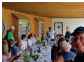
Campertafel, fein gerichtet