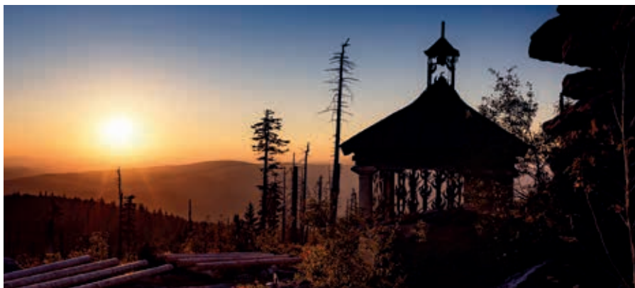
Johann-Nepomuk Neumann Kapelle am Hochstein (Dreisesselmassiv)