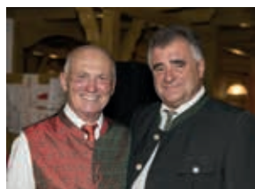
Der Bürgermeister (re)

18.00 Uhr Sektempfang, Begrüßung, kurze Programmvorstellung, Kennenlernen