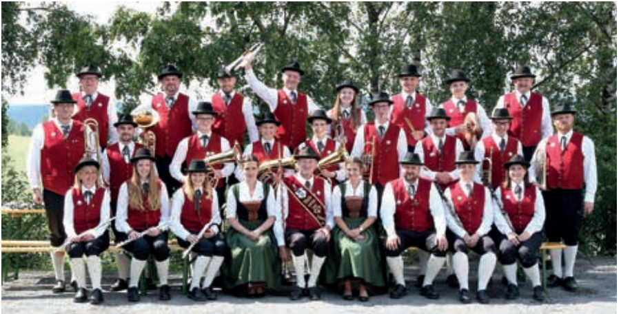
Große Blaskapelle des Musikverein Schwarzenberg am Böhmerwald

10.45 Uhr – 12.45 Uhr Aufmarsch der großen Blaskapelle des Musikvereines Schwarzenberg am Böhmerwald