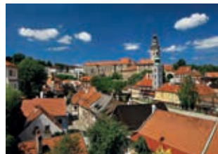
Blick zum Schloss