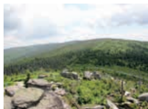
Blick nach Böhmen und Österreich