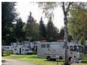
Jedem sein Plätzchen

Wir hoffen, Sie hatten eine gute Anreise und haben eine frohe Erwartungshaltung. Gerne zeigen wir Ihnen Ihren möglichen Wunschplatz. Für Freunde, die zusammen stehen wollen, reservieren wir Plätze nebeneinander. In kleinen Gruppen möchten wir Sie in die „Kultur“ dieser Erlebniswoche einweisen, Sie mit der Infrastruktur des KNAUS Campingparks bekannt machen und auf spezielle Wünsche hören. Sie haben freien Zugang zum beheizten Hallenbad, zu den – münzfreien – Warmwasserduschen, sanitären Anlagen, zum Wäschewasch-, Koch- sowie Geschirrspülraum. Alles inklusiv!