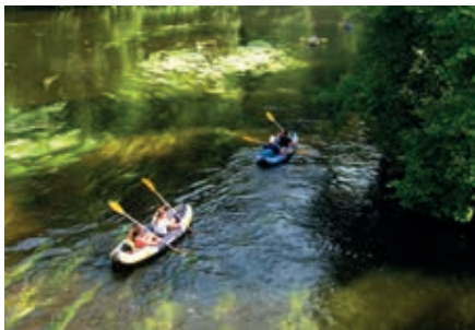
Idylle und Stille pur

Auf der gewählten Strecke zeigt sich die schwarze, glitzernde Ilz von ihrer schönsten Seite. Die flotte, aber ungefährliche Strömung sorgt für viel Spaß beim Fahren mit den Paddelbooten. Mit unserem Bootsguide tauchen Sie mit ihren kentersicheren Zweier-Schlauchkanus in steile Täler und dichte, urige Nadelwälder ein, bevor Sie gegen 14.00 Uhr den Ausstieg im kleinen Ort Fischhaus erreichen und mit dem Bus zurück zum Treffpunkt „Michlbauer“ fahren, wo die andere Gruppe gerade von der Planwagenfahrt zurückgekommen ist. Die Bootstour kann ab einer Mindestbeteiligung von zehn „Wasserratten“ realisiert werden. Ihr Hund kann nach Absprache mit dem Mitfahrer mit in das Zweier-Paddelboot. Für den Hund, nein, für das Boot unbedingt eine Hundedecke mitbringen. Bei Regen fällt die Tour „ins Wasser“ und Sie steigen in den Planwagen.