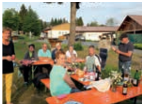
Abend aus d. „Perigor“ (F)